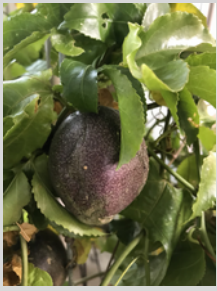
パッションフルーツの果実

私はちょっと珍しい植物を育てるのが好きなので、今年はこちらのもの「パッションフルーツ」の育成にチャレンジしています。