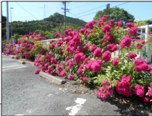
駐車場フェンスを覆ったバラの花

表の駐車場フェンスのバラが満開になりました。濃いピンク色でとても目立ちますが、周りの木々の緑とのバランスが良く、きれいな景色になっています。 梅雨の晴れ間に、野菜たちも元気に育ってきており、今年も収穫が楽しみです。