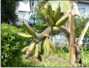
バナナも遅く育っています！