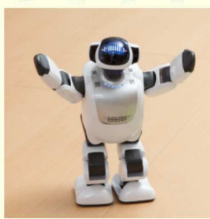
H27.3月導入予定 「PALRO」(パルロ)

当院では、療養施設用コミュニケーションロボットの新日導入を予定しています。患者様との会話やレクリエーションで楽しんで頂くと同時に、認知症の予防等の効果があるとされており、今後の活躍が期待されます。患者様とのふれあいの様子も掲載していく予定です。おたのしみに！