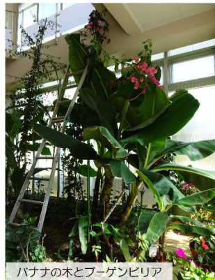
バナナの木とブルーベリー