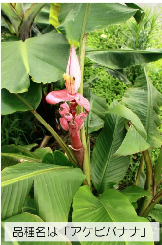
品種名は「アケビバナナ」